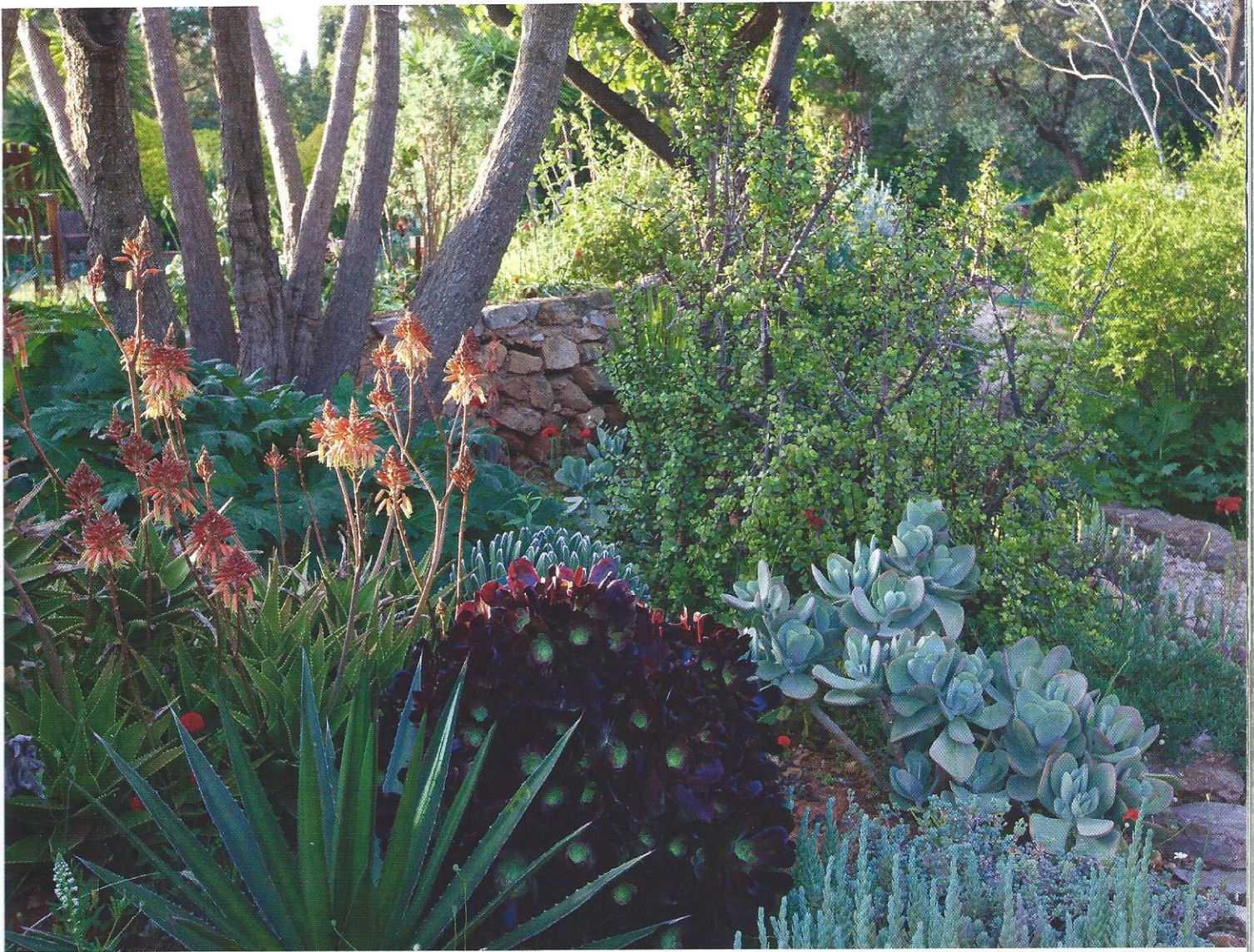
Un jardin de succulentes a envahi les terrasses sèches, ponctué d'aloès arborescens en fleur au début du printemps.

Garden Society (MGS) , réseau qui relie des jardiniers du monde entier. Cette association a poursuivi le projet botanique initial sous l'œil attentif de Sally Razelou, devenue conservatrice et gardienne du jardin durant plus de trente ans, aidée par des bénévoles et des stagiaires.