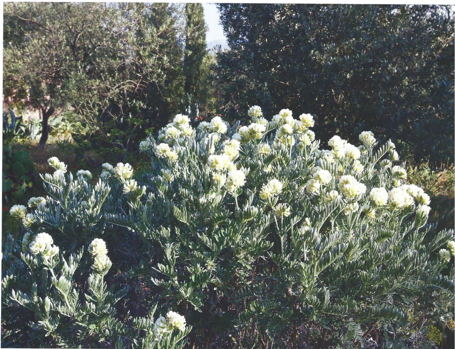
La barbe de Jupiter, plante endémique de l'est de la Méditerranée, forme au printemps de superbes buissons couronnés de fleurs blanches.

En attendant l'automne, d'autres plantes réduisent la surface de leurs feuillages, comme le chardon local, le Ptilostemon chamaepeuce . Les fleurs s'effacent, cédant la place à des architectures végétales dépouillées. Il faut attendre les pluies d'automne pour la renaissance du jardin. Les bulbes endormis se réveillent à partir de la fin octobre : cyclamens de Grèce, scilles, crocus et autres plantes géophytes émergent parmi le duvet des graminées en repousse. À côté de cette végétation locale, les espèces d'autres continents réapparaissent, ponctuées par les nouvelles floraisons des amaryllis sud-africaines ( Amaryllis belladonna ) et des lis blancs d'Amérique (zephyrantes)... la fin de l'automne annonce toujours à Sparoza l'arrivée d'un second printemps. 🌸